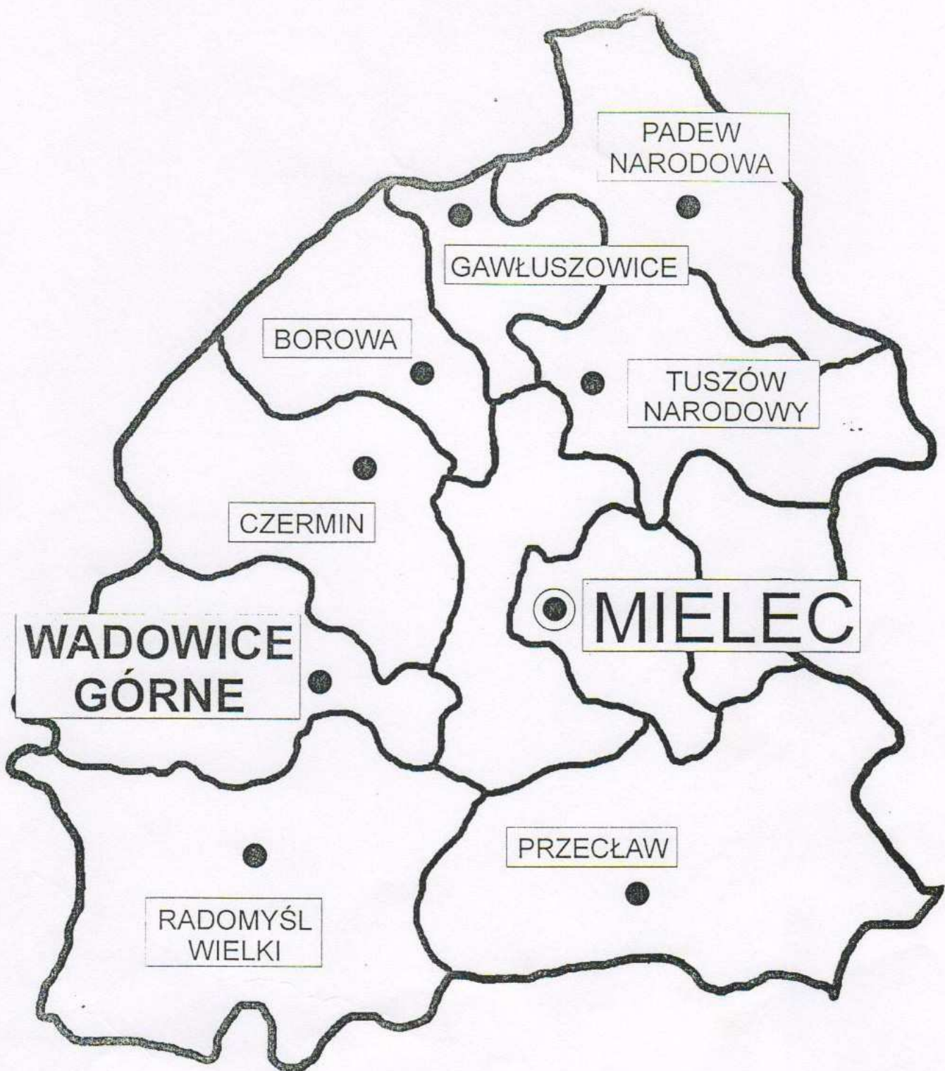
Położenie gminy Wadowice Górne w powiecie mieleckim.