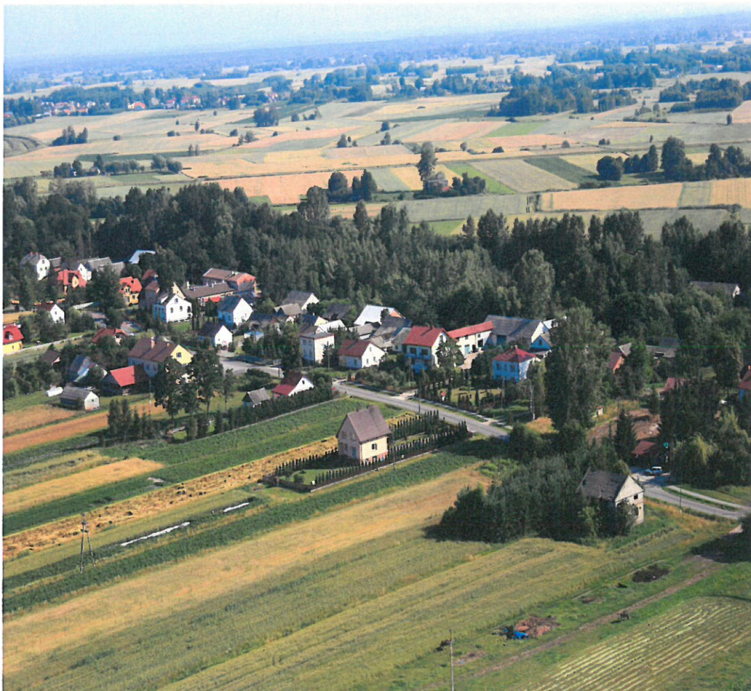
Gmina Wadowice Górne